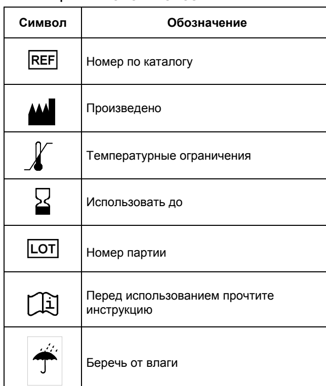
ТАБЛИЦА СИМВОЛОВ И ОБОЗНАЧЕНИЙ

BIOMERIEUX и логотип являются зарегистрированными (или находящимися в процессе регистрации) торговыми марками компании bioMérieux SA. Все права защищены